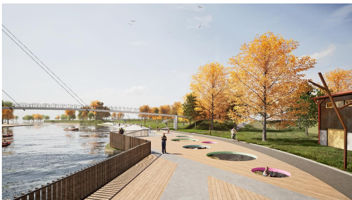
Il. 6. Pomost z miejscami do „leżakowania” nad wodą

Dalej w kierunku północnym, za mostem wantowym, przy istniejących tarasach zorganizowano drewniany pomost nad dawną „zatoką” dla kajaków. Usytuowanie pomostu nad wodą umożliwiło zorganizowanie wyjątkowego miejsca do odpoczynku i „leżakowania” w formie otworów w posadce z siatką z lin. Całość strefy uzupełniają elementy rekreacyjne w formie trampolin w posadce oraz wodny plac zabaw usytuowany na plaży po drugiej stronie rzeki.