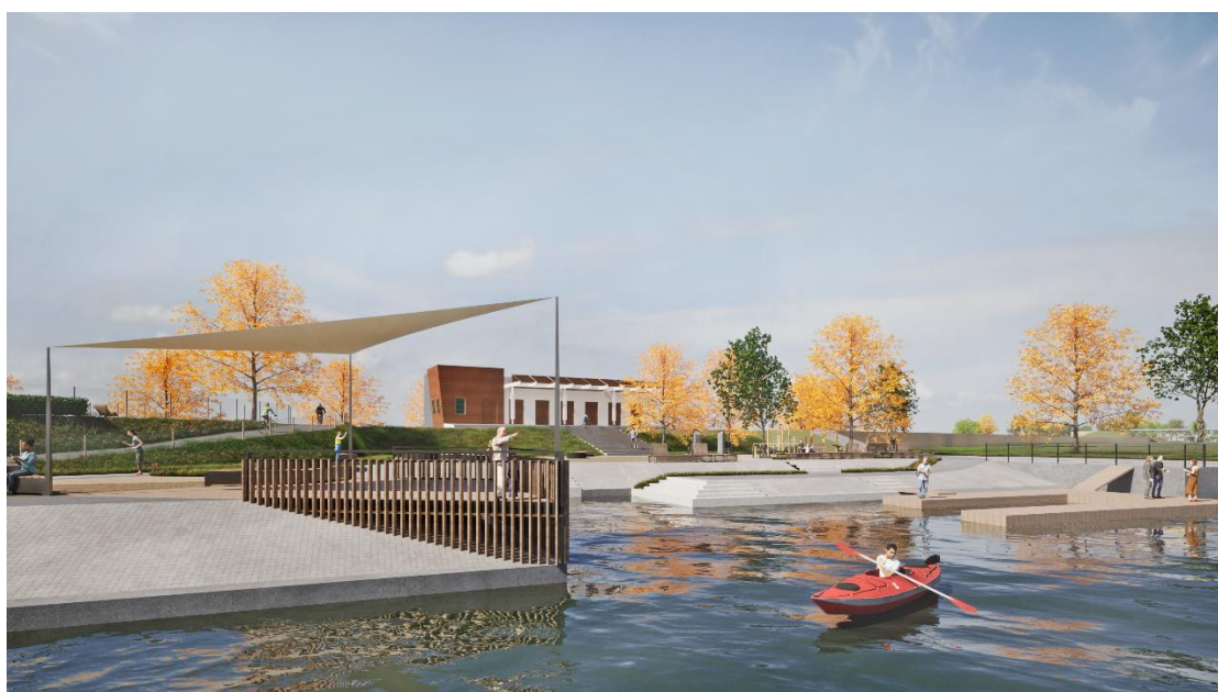
Il. 8. Punkt widokowy na przystań kajakową

W obrębie przystani kajakowej zaprojektowano otwartą siłownię zewnętrzną z urządzeniami do street workout'u oraz miejsce do organizacji ognisk i niewielkich imprez plenerowych z ogólnodostępnym paleniskiem. W zamkniętej strefie basenów powiększono skarpę z częścią kąpieliskową dodając jeszcze jedną nieckę basenów.