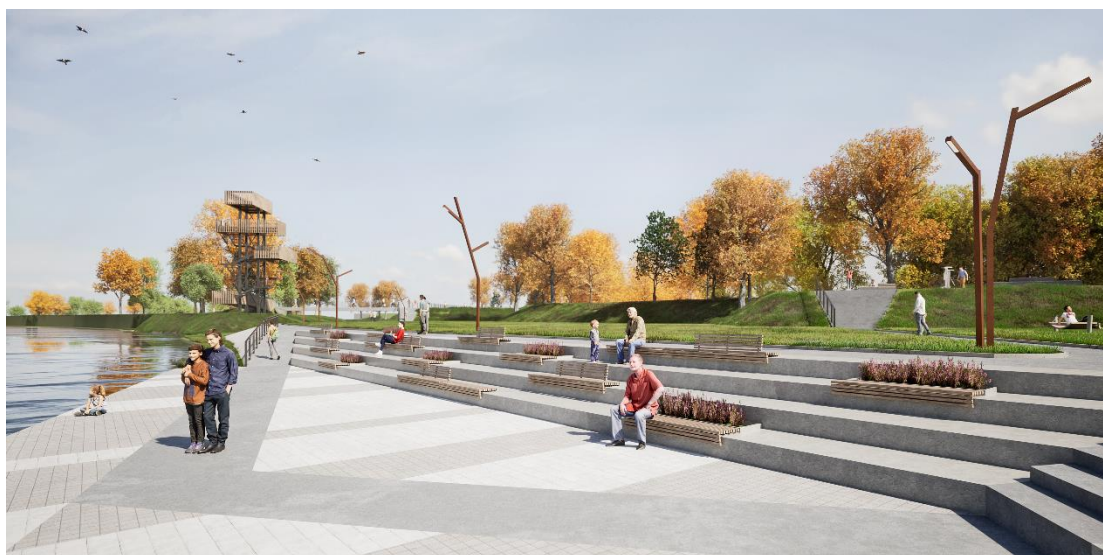
Il. 5. Plac nabrzeżny z siedziskami

Z kolei tuż przy rzece zorganizowano niewielki plac z w formie trójkątnego wcięcia w linii brzegowej z siedziskami usytuowanymi na spadkach terenu, umożliwiającymi obserwację drugiego brzegu rzeki z plażą i kąpieliskiem.