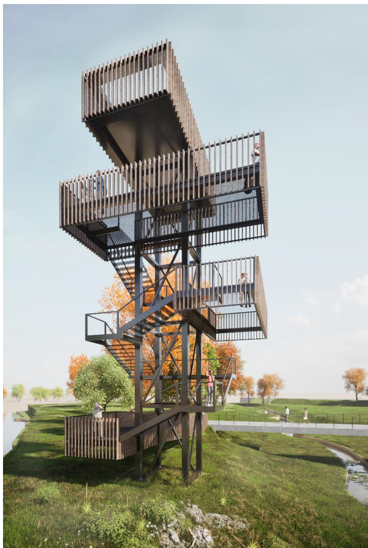
II.2. Wieża widokowa

Strefa przyrodnicza ma za zadanie ochronę i obserwację bioróżnorodności fauny i flory nadbrzeża rzeki Warty i Żegliny. Głównym elementem umożliwiającym obserwację nadwarciańskiego krajobrazu jest wieża widokowa, usytuowana na półwyspie tuż przy ujściu rzeki Żegliny do rzeki Warty. Dostęp na półwysp zapewnia istniejący mostek na Żeglinie, natomiast dojście do mostku od strony ulicy Sienkiewicza zorganizowano w formie kładki pieszej usytuowanej ponad łąką kwiatną, która obecnie jest urządzona w przestrzeni szerokiego koryta rzeki Żegliny. Wieża widokowa posiada trzy tarasy usytuowane na różnych poziomach, skierowane w odmiennych kierunkach, umożliwiające obserwacje walorów kultowych i przyrodniczych doliny Warty i Starego Miasta w Sieradzu z różnych perspektyw.