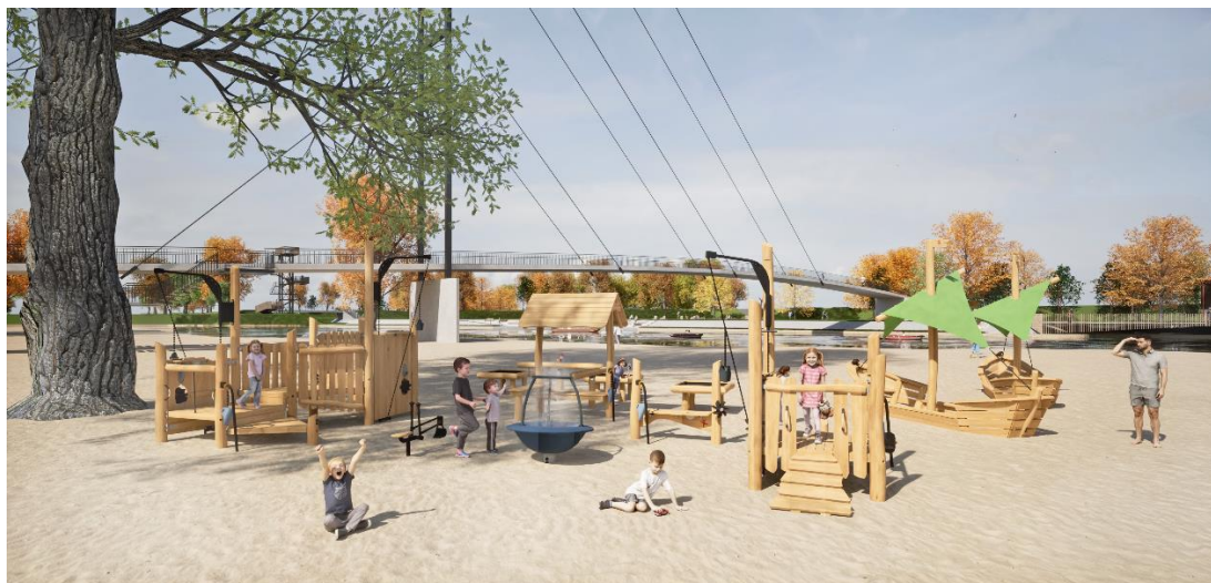
Il. 7. Wodny plac zabaw