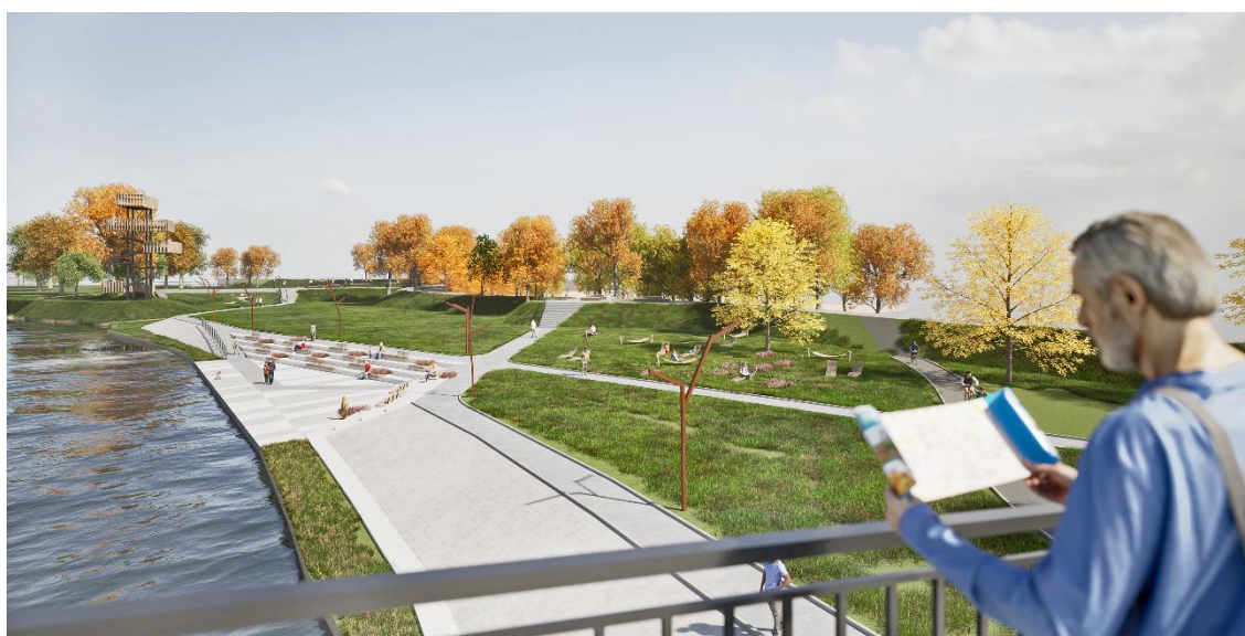
II.4. Widok z mostu wantungo na bulwary nad rzeką Wartą