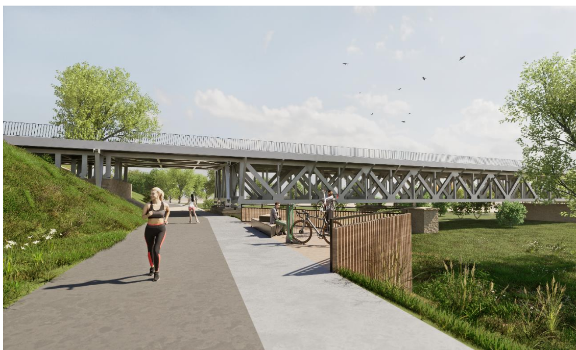
II.9 Ścieżka rowerowa z punktem serwisowym przy moście kolejowym nad rzeką Wartą

Planowana budowa drogi rowerowej wzdłuż rzeki Warty łącząca się z Parkiem Staromiejskim, osiedlem Dziewiarz, parkiem Mickiewicza i Wzgórzem Zamkowym będzie stanowić istotny element infrastruktury rowerowej w Sieradzu.