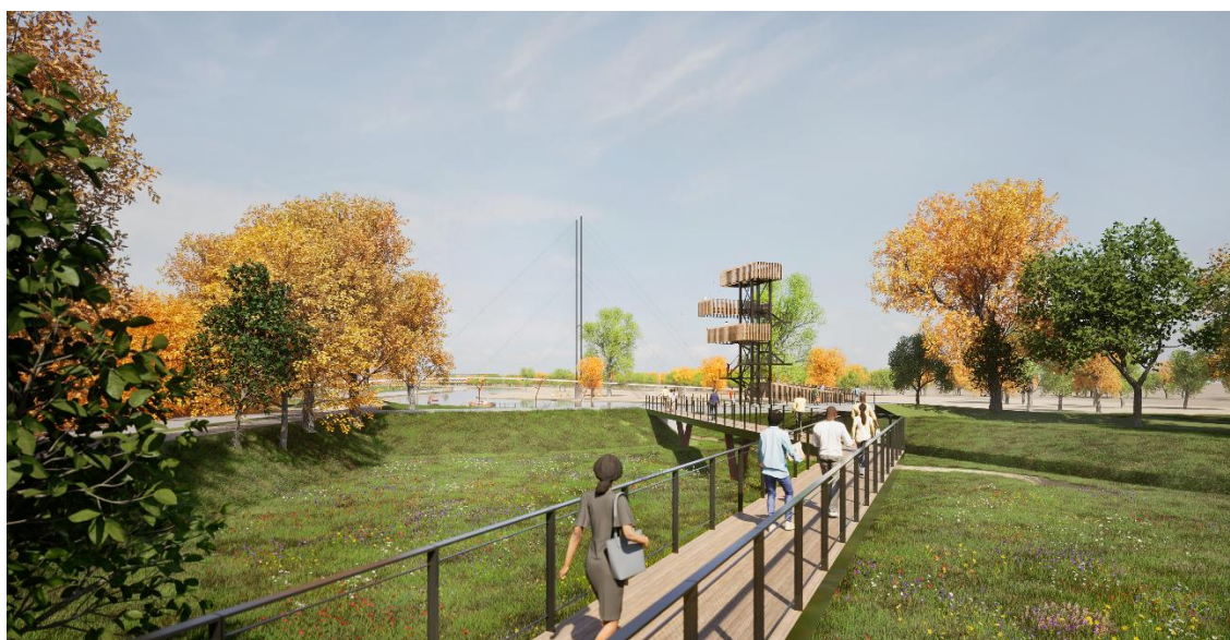
II.3. Ścieżka piesza nad kwietną łąką